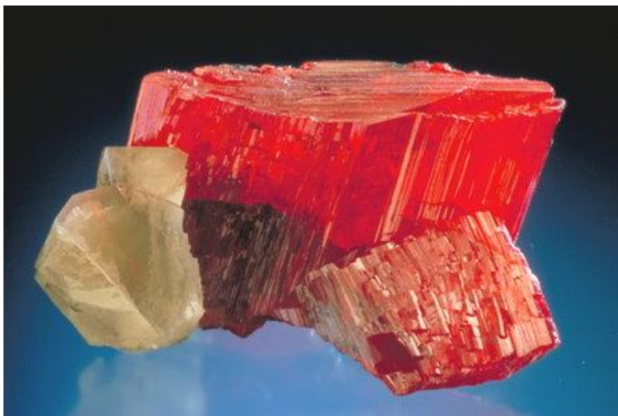
Tiefroter Realgar aus China

Gäste sind wie immer herzlich willkommen.