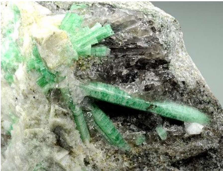
Smaragd-Stern in Quarz, Brasilien, (Breite: ca. 7cm) fotografiert am Bestimmungsabend