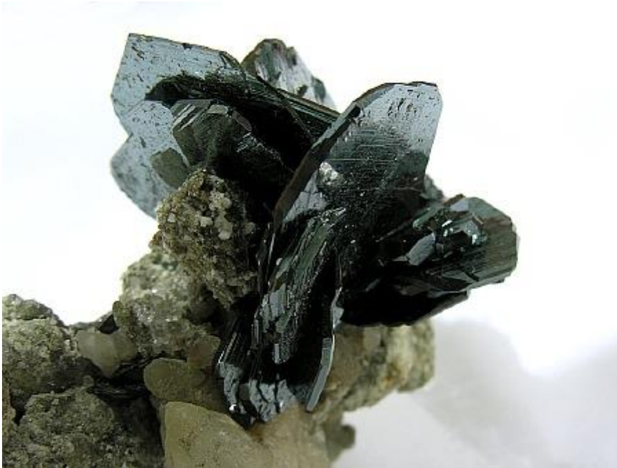
Hämatit mit Rutil und Calcit von der Cavradischlucht GR (Coll. P. Berther) Nebenstehendes Bild wurde an der Sonderschau der Mineralienbörse 2007 Zürich gemacht. Weitere Bilder sind zu finden unter kristalle.ch