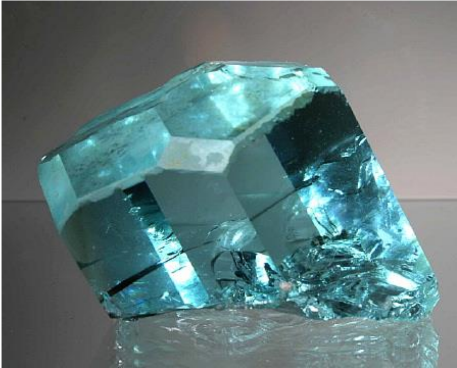
Wunderbarer Aquamarin aus Pakistan