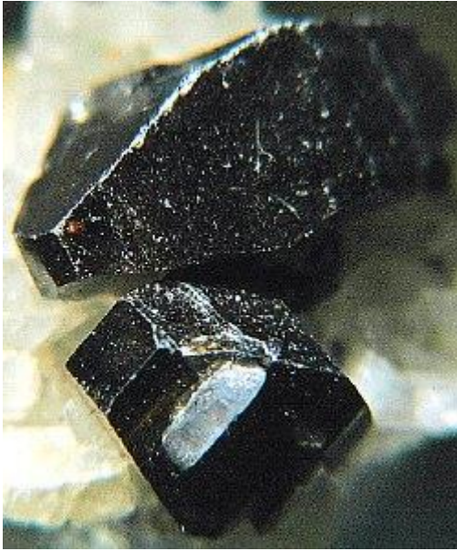
Bild rechts: Adapter (Durchmesser bei Okularanschluss 25 mm; mittels mitgelieferter Hülse auch für weniger möglich).

Nachdem ich den Adapter heute erhalten habe, probierte ich ihn sogleich aus. Trotz der angeblichen "Beinaheuntauglichkeit" mit der D70s bin ich über die gelungenen Aufnahmen hocheifrig und bestens zufrieden.