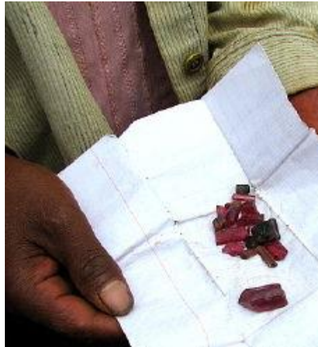
Turmaline werden bei Ibity angeboten

Nebst dem Reichtum an Bodenschätzen bietet das Land aber auch unzählige Attraktionen und der Reisende erlebt täglich ein kleines Abenteuer.