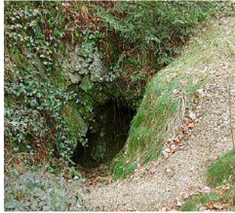
Mundloch des kurzen Jeremias-Stollens (Funde auf Halde: Quarz, Pyromorphit, Wulfenit)