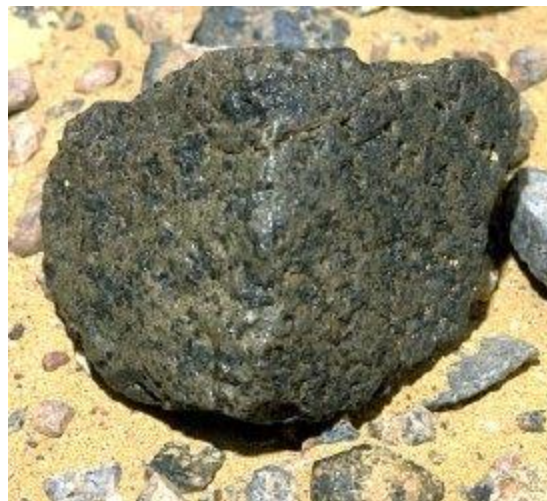
Gefunden von Marc Hauser und Lorenz Moser am 8. Februar 2001 im Oman. Dimensionen 4x5x7 cm, 223.3g