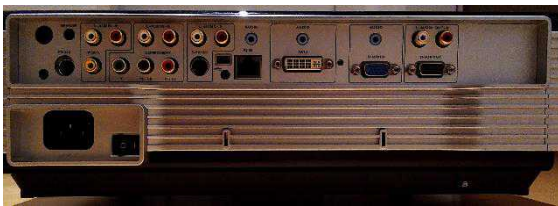
Beamer Rückansicht mit seinen Anschlussmöglichkeiten.