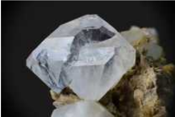
Ein wunderbares Bild eines kleinen Quarzes.

Weitere Exkursionsbilder sind zu finden unter: https://www.instagram.com/zuercher_mineraliensammler/