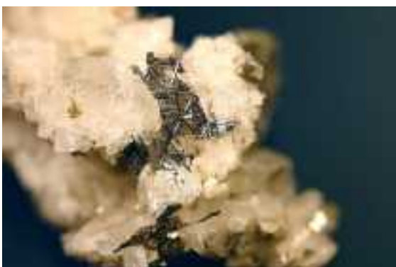
Rutil-Sagenit, Bildbreite 3cm; Fundort Arzo, TI; Finder und Sammlung: Heinz Aeschbacher

Am 9. November 2022 fanden sich eine schöne Anzahl unserer Mitglieder im Gemeinschaftszentrum Riesbach ein, um ihre Mineralien zu bestimmen und fotografieren zu lassen. Felix half mit Binokular und Literatur bei der Bestimmung und Olivier fotografierte die schönsten Objekte. Der Abend wurde auch sehr rege zum gegenseitigen Austausch genutzt. Ebenso wurden Mineralien getauscht und/oder verkauft. Ein erfolgreicher Abend.