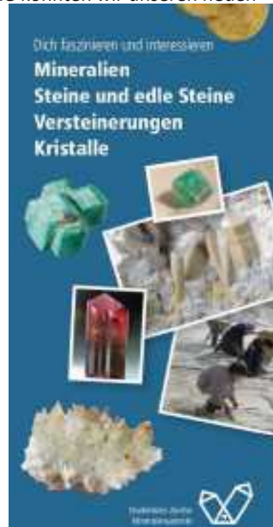
Der Look unseres neuen SZM-Flyers

Dank der Unterstützung durch die Siber + Siber AG konnten wir unseren neuen