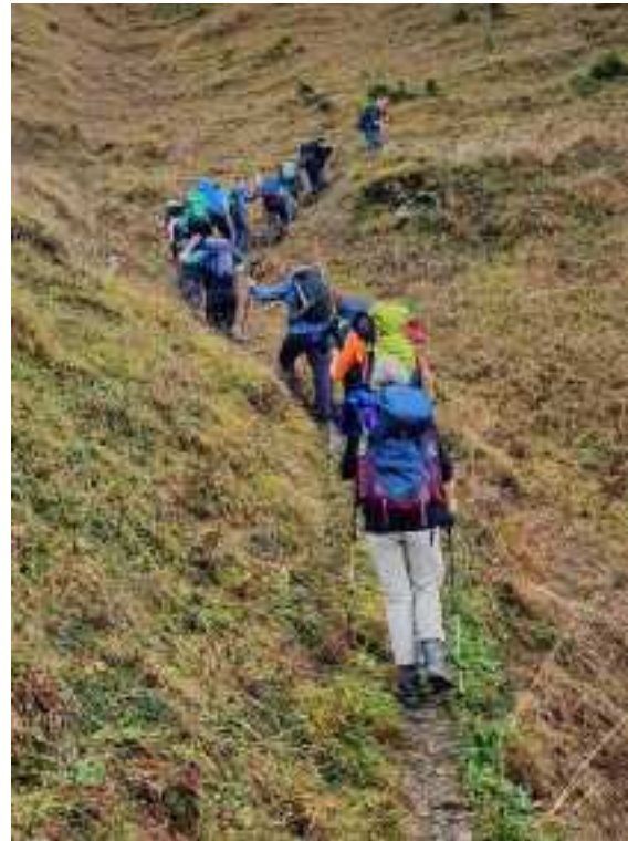
Der Aufstieg erfolgt in stark geneigtem Gelände.

Und wieder einmal machte es das Wetter leider extrem spannend, bis unmittelbar vor dem Abmarsch Richtung Wasserberg. Alle an der Exkursion Teilnehmenden und vor allem unsere beiden Exkursionsleiter Richi und Michi hätten sicherlich sehr gerne auf diese Art von Spannung verzichtet. Die Wettervorhersage war, um es nett auszudrücken, 'bescheiden'. Wir mussten damit rechnen, kaum oben angekommen, wegen den kühlen Temperaturen und dem starken Regen, der vorhergesagt war, direkt wieder umzukehren. Richi fragte uns Teilnehmenden, ob wir den Aufstieg wagen oder ob wir gleich wieder den Heimweg antreten wollen. Wir entschieden uns fürs Losmarschieren.